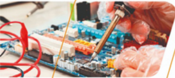
Mantenimiento y soporte técnico

Ofrecemos los siguientes servicios, cumpliendo con la exigencia de nuestros clientes con la experiencia, garantía y calidad de nuestro equipo logístico y técnico.