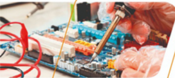
Mantenimiento y soporte técnico

Ofrecemos los siguientes servicios, cumpliendo con la exigencia de nuestros clientes con la experiencia, garantía y calidad de nuestro equipo logístico y técnico.